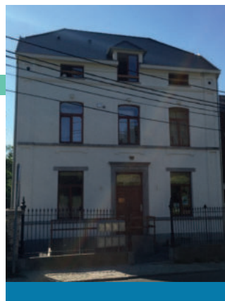
COURT-ST-ÉTIENNE – LA BIENVENUE